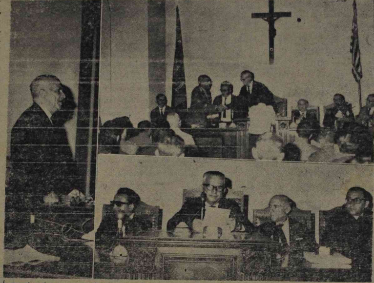
À tarde de ontem, foram instalados os trabalhos da Assembléia Legislativa do Estado do Piauí do ano de 1969. Na foto, vemos o aspecto da solenidade.

As cerimônias estiveram presentes o Governador Helvídio Nunes de Barros, autoridades civis e militares, Secretários de Estado, Desembargadores, Jornalistas e grande número de populares.